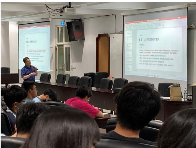
說明：講解有關勞動契約的性質