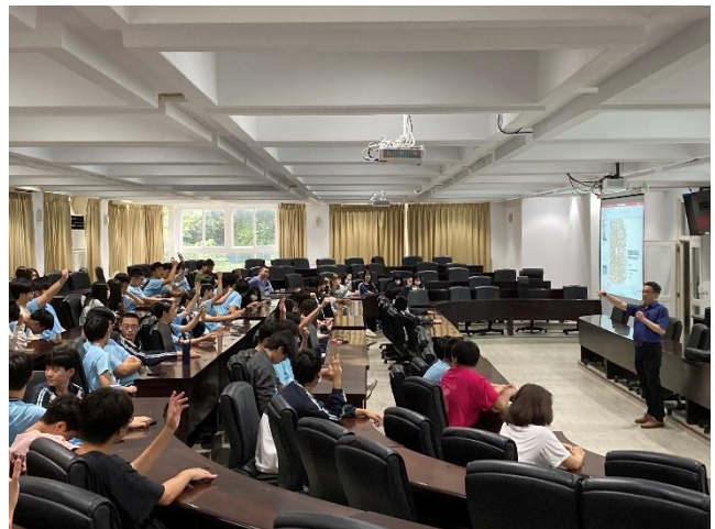
說明：講師與學生互動提問